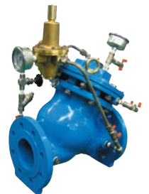
콘 디스크형 컨트롤 밸브