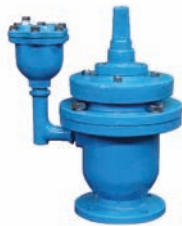
다기능 에어리리즈 밸브