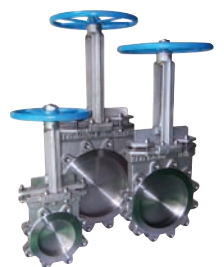
나이프 게이트 밸브