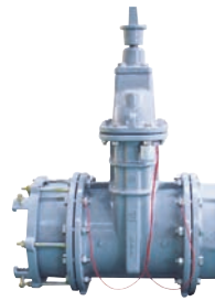
부식방지 양면 소프트 실 제수밸브