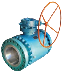
트리니온 볼 밸브