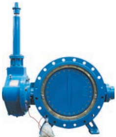
부식방지 3중편심 버터플라이밸브