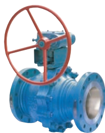
플로팅 볼 밸브